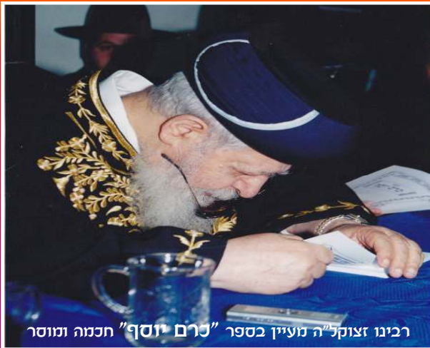
רבינו זצוקל"ה נוע"ץ בספר "נרם יוסף" חכמה ומוסר