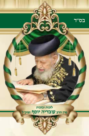
ליכות וכוונות מרב הרב עובדיה יוסף זצוק"ל