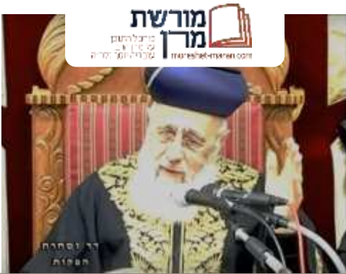
* האתר לא מונעד לאתרבים ובישיבות ומיועד למי שיש בתשומת חובתו לרשת באישרת

מידי שבוע באתר "מורשת מרן" שידור חי משיעורו השבועי הגדול בתבל של מרן רבינו יצחק יוסף שליט"א www.moreshet-maran.com