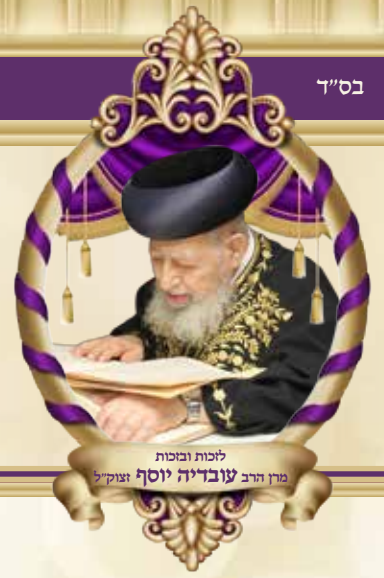
ליכות וכוזבת מרב הרב עובדיה יוסף זצוק"ל (משמשים בקודש)