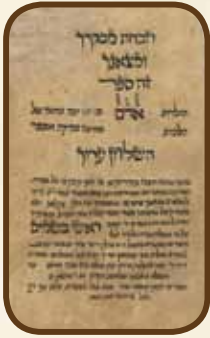
צילום כתב יד מהמהר"ץ מפורשו של רבי יוד מוהרי (משוקי) משנת תקל"ה

"אנא, רבנו של עולם. וכני נא שלידי הראשון אשר יוולד לי, בן זכר הוא זה, ואקדיש אותו לעבודתך ויראתך!"