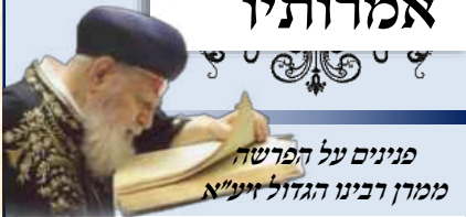
פנינים על הפרשה ממרן רבינו הגדול זיע"א