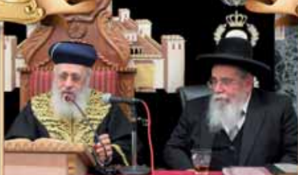
הרב המקדים: הגאון הגדול רבי אברהם סאלים שליט"א ראש ישיבת "מאור התורה"

שיעורו השבועי של מרן הראש"ל הרה"ג לישראל אב"ד בביה"ד העליון הגאון הגדול רבי יצחק יוסף שליט"א נשיא מועצת הרבנות הראשית לישראל