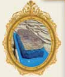
למשפחת בן עטר הוא בושם)