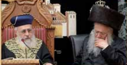
הרב המקדים: הרה"ג רבי יוסף אפרתי שליט"א ראש בית מדרש להלכה בחייחשובות

שיעורו השבועי של מרן הראש"ל הרה"ק לישראל אב"ד במיח"ד העליון הגאון הגדול רבי יצחק יוסף שליט"א נשיא מועצת הרבנות הראשית לישראל