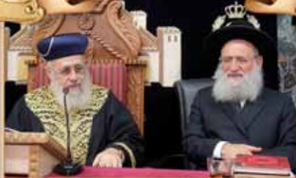
הרב המקדים: הגאון הגדול רבי ראובן אלבז שליט"א ראש ישיבת "אור החיים" וחבר מועצת חכמי התורה

שיעורו השבועי של מרן הראש"ל הרה"ר לישראל אב"ד בביה"ד העליון הגאון הגדול רבי יצחק יוסף שליט"א נשיא מועצת הרבנות הראשית לישראל