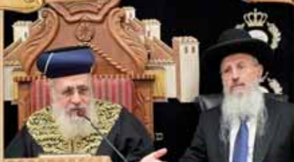
הרב המקדים: הגאון הגדול רבי אברהם יוסף שליט"א רב העיר חולון