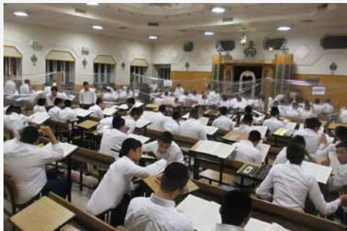
טוב אחד בצער. מי שמקריב את שעותיו למרות הקושי, מגיע ליעד הנכסף

מה מנע מתלמיד הישיבה לשוב לביתו ולפרוק עול? ■ סיפור מפעים על כח הרצון והחלטה נחושה