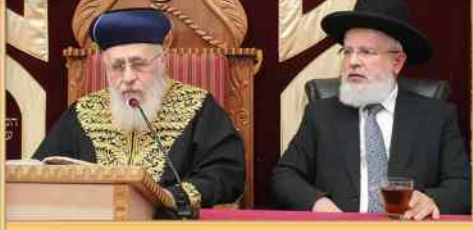
הרב המקדים: הרה"ג רבי זבדיה כהן שליט"א ראב"ד בתל - אביב

שיעורו השבועי של מרן הראש"ל הרה"ר לישראל אב"ד בביה"ד העליון הגאון הגדול רבי יצחק יוסף שליט"א נשיא מועצת הרבנות הראשית לישראל